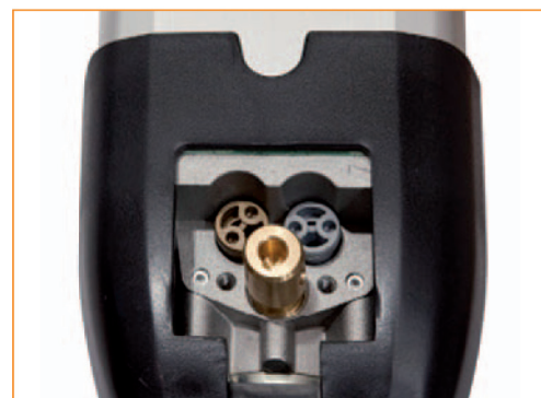
Vis by-pass - By pass screws