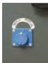
Déverrouillage à clé facile à utiliser