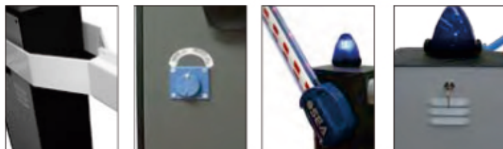
Double bras de fixation de la lisse

Barrière automatique sûre, rapide à basse tension Vitesse de fonctionnement réglable en ouverture et en fermeture Batteries d'urgence en option pour fonctionnement même en l'absence de courant électrique Possibilité d'ajouter le panneau solaire KIT SUNNY Fins de course mécaniques et électroniques intégrés Lisse ovale LINEAR en aluminium avec double profilé antichoc et KIT éclairage en option