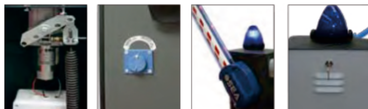
Photo de l'intérieur

Barrière automatique sûre, rapide à basse tension Vitesse de ralentissement réglable en ouverture et en fermeture Dispositif d'inversion sur obstacle avec réglage de la sécurité Coffre en acier avec traitement cataphorèse et peinture polyester pour une résistance minimale dans le temps Nouvelle lisse ovale avec double profilé antichoc et KIT éclairage en option