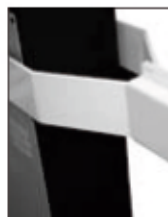
Déverrouillage à clé facile à utiliser